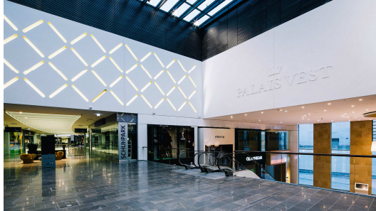
Innenansicht des Palais Vest in Recklinghausen, eröffnet im September 2014